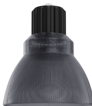
GYSM Gris fumé